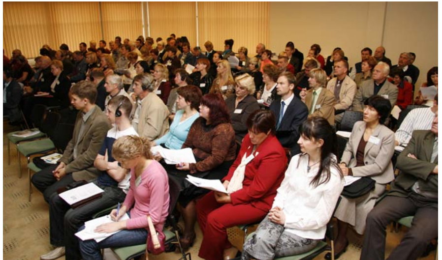
Visvairāk interesentu bija Daugavpilī organizētajam semināram

Ņemot vērā VDI informāciju, ka 90 % cilvēku noteiktā dzīves posmā cieš no balsta un kustību sistēmas darbības, kā arī ar darbu saistītiem kakla un augšējo ekstremitāšu traucējumiem un slimībām un to, ka šī problēma ir plaši izplatīta nodarbināto vidū tieši mazos un vidējos uzņēmumos, kampaņas ietvaros galvenā uzmanība tika pievērsta iepriekš minētā riska izraisošajiem faktoriem un ergonomisku darbavietu ierīkošanas nepieciešamībai. Latvijā orga-