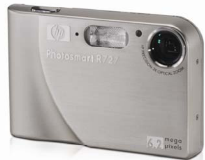
Konkursa uzvarētājs saņems fotokameru “HP Photosmart R727” un citas balvas

Latvijā Eiropas nedēļa drošībai un veselībai darbā 2007 „Stop – pārslodze!” tika atklāta 6. jūnijā. Līdz kampaņas kulminācijai – Eiropas nedēļai, kas norisināsies no 22. līdz 26.oktobrim, VDI sadarībā ar sociālajiem partneriem: Labklājības ministriju, Latvijas Darba devēju konfederāciju, Latvijas Brīvo arodbiedrību savienību un Darba un vides veselības institūtu organizēs vairākas izglītojošas aktivitātes jaunie-