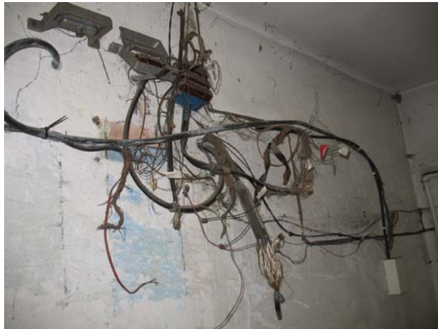
Uzņēmumu apsekošanas laikā bija redzami arī šādi skati

VDI statistika rāda, ka 2006. gadā kokapstrādes nozarē reģistrēti 242 nelaimes gadījumi darbā. 10 darbinieki traumu rezultātā bija gājuši bojā, bet 31 gadījumos bija gūtas smagas traumas. 2006.gadā VDI reģistrēti 29 arodsaslimšanas gadījumi kokapstrādes nozarē, bet 2007.gada pirmajā pusē – 12.