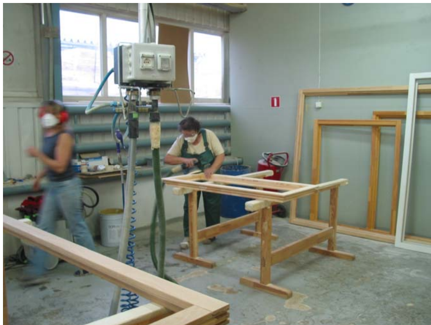
Inspicēšanas kampaņas apsekojumu laikā inspektori pārliecinājās, ka ir uzņēmumi, kuros darba apstākļiem tiek pievērsta īpaša uzmanība

„Kaut arī vairāk kā 200 Latvijas kokapstrādes uzņēmumiem Valsts darba inspekcija oktobra sākumā nosūtīja vēstules, ar kurām personīgi informēja darba devējus par kampaņas norisi, apsekojumu laikā tika konstatēta virkne pārkāpumu. Diemžēl darba devēji joprojām atrunājas, sakot: mēs domājam, ka pie mums inspektori neatnāks,” uzsver