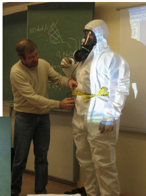
Katrs dalībnieks praksē izmēģina pareizu aizsargtērpu un aizsardzības līdzekļu lietošanu

Nākamais šāda veida apmācības kurss tiek plānots 2008. gada martā.