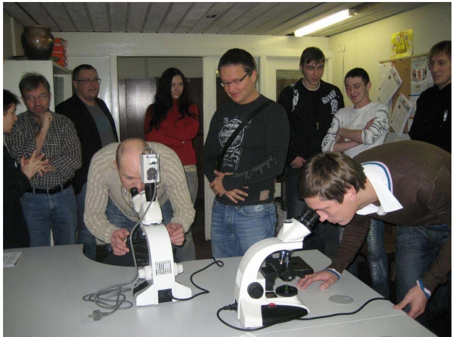
Azbesta saturošo materiālu inventarizācijas laikā paņemtie materiālu paraugi tiek aplūkoti speciālos mikroskopos Azbesta laboratorijā

Mācību laikā tika apgūtas nepieciešamās zināšanas, lai varētu sekmīgi identificēt azbestu saturošos materiālus (veicot azbestu saturošo materiālu inventarizāciju un paraugu ņemšanu), pareizi plānot darbu veikšanu un droši veikt materiālu demontāžu dažādos apstākļos.