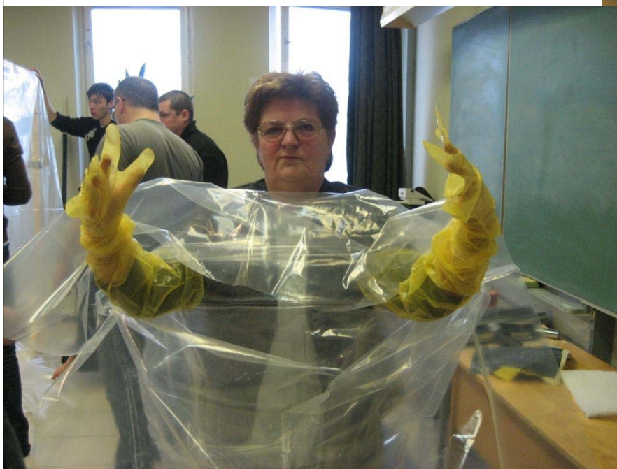
Tiek iepazīta viena no demontāžas tehnikām – t.s. cimdu lietošana.