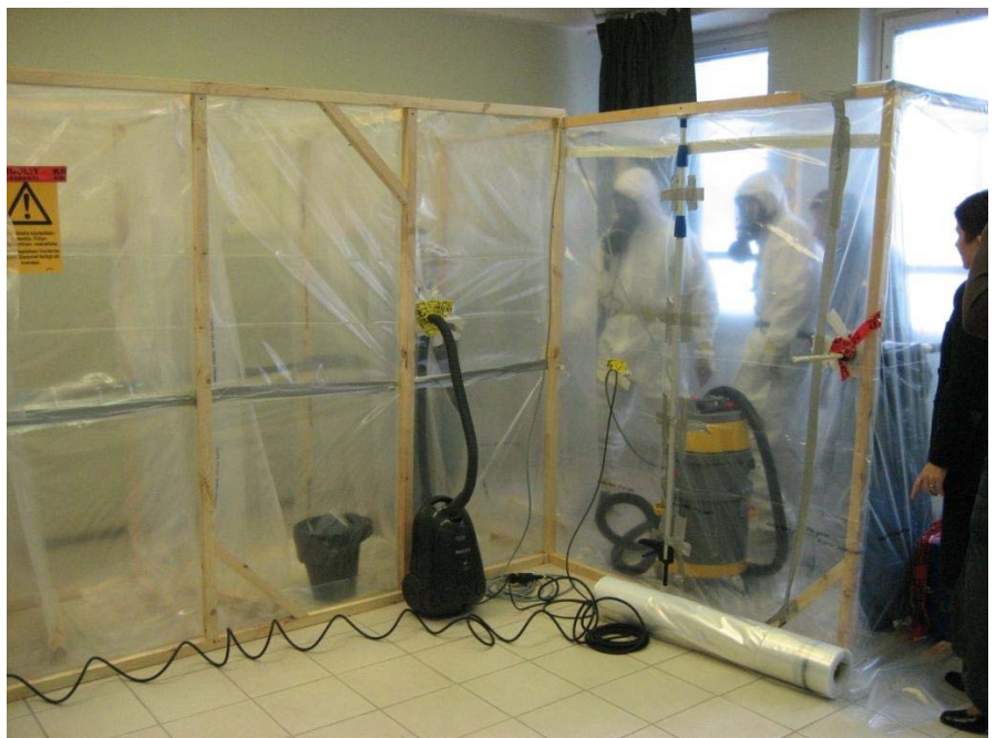
Dalībnieki kopīgiem spēkiem ir uzbūvējuši daudzkameru demontāžas zonu ar negatīvu gaisa spiedienu un mācās veikt darbus šajā zonā, izmantojot visu nepieciešamo aprīkojumu