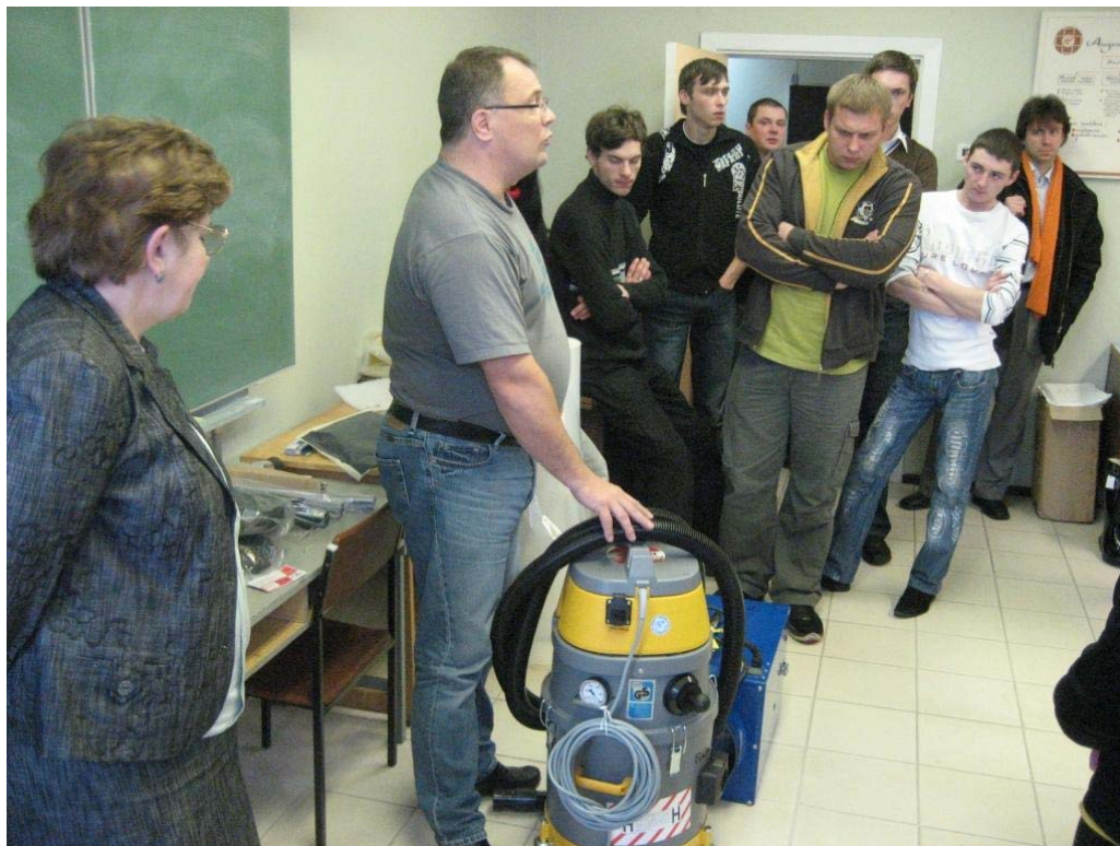
Azbesta demontāžai nepieciešamā aprīkojuma demonstrācija

Šādu apmācību organizēšana ir pirmais solis, lai Latvijā reāli tiktu sākti prasībām atbilstoša azbestu saturošo materiālu demontāža.