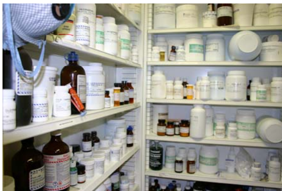
Klasifikators papildināts arī ar profesiju farmaceutisko produktu speciālists

Atgādinām, ka profesiju klasifikators tiek aktualizēts pēc nepieciešamības,