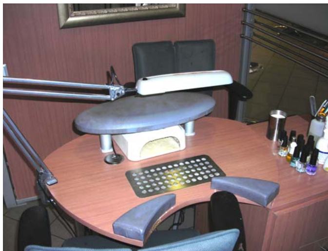
Attēlā redzamais manikīra galds aprīkots atbilstoši darba aizsardzības prasībām

“Neraugoties uz to, bija paties prieks redzēt, ka ir arī frizētavas, kas aprīkotas atbilstoši darba aizsardzības