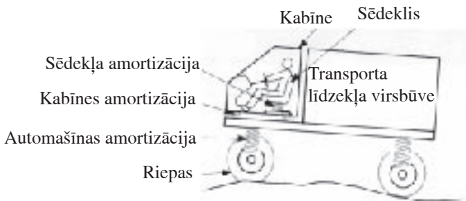
Attēls 1.: Transporta līdzekļa iespējamie piekares un amortizējošo sistēmu risinājumi.